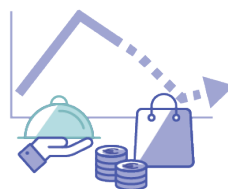
Inflaation hidastuminen parantaa ostovoimaa ja virkistää yksityistä kulutusta