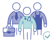
Työllisyys talouden valopilkkuna