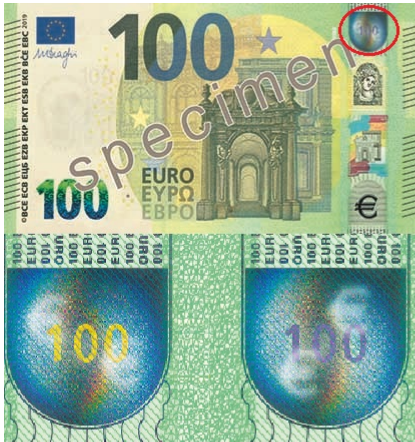
Sadan euron hologramminauhassa euron tunnukset kiertävät ympyrää satelliitin tavoin.

Sadan dollarin setelissä on erikoisuutena puolestaan keskellä seteliä sininen turvalanka, jossa on liikkuvia kellon ja satasen kuvia. Kun käännät seteliä ylhäältä alas, kellosymboli liikkuu vasemmalta oikealle muuttuen arvoksi sata. Kun taivutat seteliä vasemmalta oikealle, kuviot liikkuvat ylös alas. Tämän lisäksi kyseessä on sukeltava turvalanka, koska turvalanka jää osan matkaa paperin pinnan alle. Vaaleat kohdat ovatkin paperia sinisen nauhan päällä. Turvalanka on ujutettu paperikerrosten väliin jo paperinvalmistuksessa. Turvalanka on myöskin vanhaa tekniikkaa, mutta kuvion vaihtuminen on uusi toiminnollisuus.