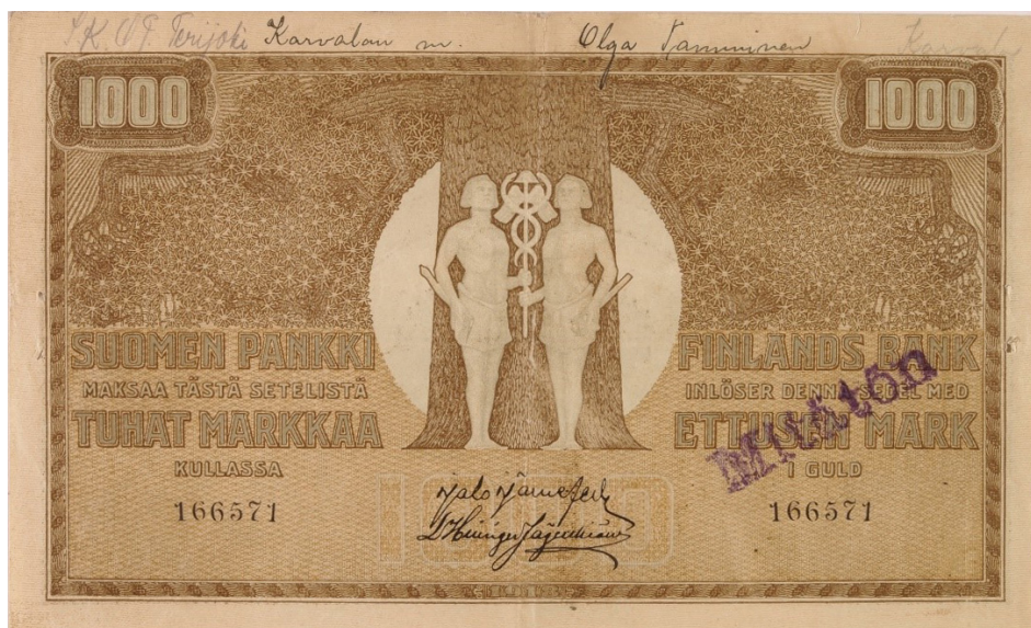
Kuva 1. Punaisen Suomen Pankin liikkeeseen laskema 1 000 markan seteli.

Punaisen Suomen Pankin liikkeeseen laskemat setelit julistettiin laittomiksi (kuva 1). Koska laittomat setelit oli mahdollista tunnistaa vain sarjanumeroista ja koska sarjanumerot olivat helppo väärentää, setelipaino laski nopeasti liikkeeseen useita korvaavia setelisarjoja. Vuoden 1918 lopussa maassa oli viisi eri versiota vuoden 1909 setelisarjasta.