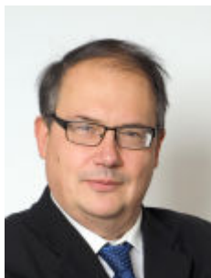
Karlo Kauko Neuvonantaja etunimi.sukunimi(at)bof.fi