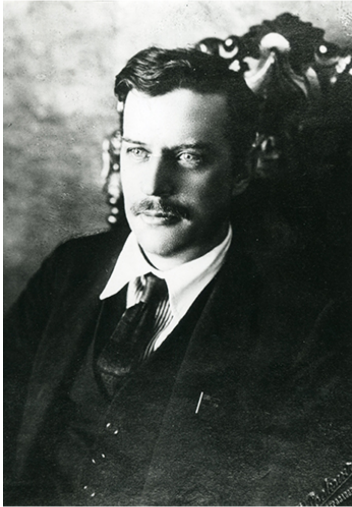
Pankkivaltuusmiesten sosialidemokraattinen puheenjohtaja Edvard Gylling