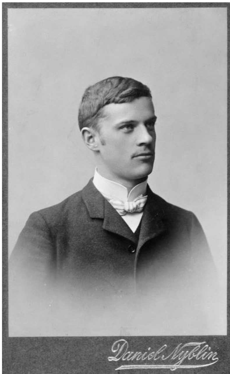
Edvard Gylling, (1881-1938). FT, tiedemies ja poliitikko.