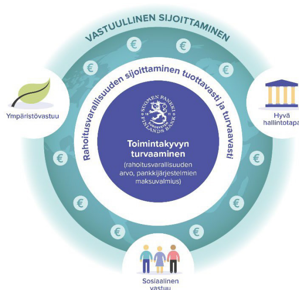
Kuva 1. Vastuullinen sijoittaminen

Keskuspankin vastuullisuus lähtee sen ydintoiminnasta. Toiminta-ajatuksemme pohjautuu taloudellisen vakauden rakentamiseen ja sitä kautta ihmisten hyvinvoinnin edistämiseen. Suomen Pankin vuonna 2019 käyttöön ottaman vastuullisuusohjelman yksi painopisteistä on ilmatoriskien hallinta. Sijoittamalla vastuullisesti Pankki antaa myös panoksensa ilmastotyöhön. Olemme julkisesti sitoutuneet liittämään ympäristöön, sosiaaliseen vastuuseen ja hyvään hallintotapaan liittyvät tekijät osaksi sijoituspäätösten tekoa ja omistajakäytäntöjä allekirjoitettuamme YK:n tukemat vastuullisen sijoittamisen periaatteet (PRI) joulukuussa 2019. Periaatteiden allekirjoittaminen tarkoittaa sitä, että rahoitusvarallisuuden hallinnassa olemme sitoutuneet vastuullisuuteen, kehitämme vastuullisen sijoitustoiminnan käytäntöjä aktiivisesti ja raportoimme edistymisestä vuosittain. Vastuullinen sijoittaminen ei heikennä pankin tekemien sijoitusten tuotto-riskisuhdetta.