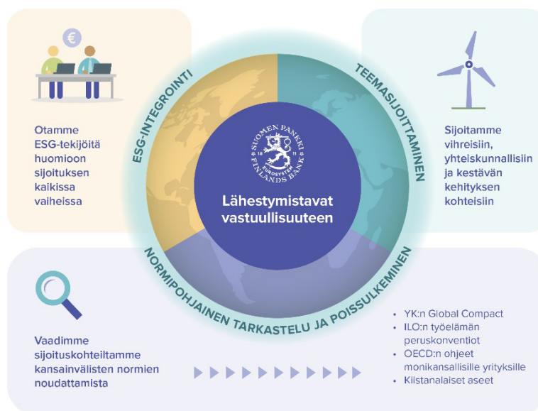
Kuva 2. Lähestymistavat vastuullisuuteen

Sijoittaja voi valita useista eri vastuullisen sijoittamisen lähestymistavoista omaan sijoitusstrategiaansa parhaiten sopivimmat. Olemme valinneet ESG-integroinnin, kansainvälisiin normeihin perustuvan poissulkemisen ja teemasijoitukset osaksi Suomen Pankin vastuullisen sijoittamisen toimintaa. Tällä hetkellä emme sijoita suoraan osakkeisiin, joten aktiivisen omistajuuden, äänestämisen ja vaikuttamisen teemat korostuvat erityisesti vastuullisuuden integroinnissa varainhoitajia valittaessa ja niiden seurannassa.