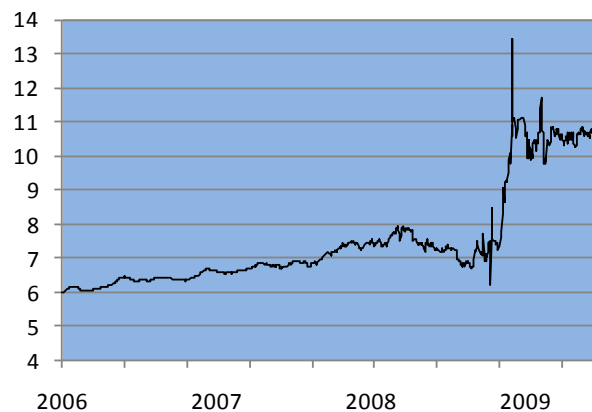
Kuvio 1 Grivna/euro-kurssi 2006–2009

pienempi. Talouden jonkinlaisesta vakautumisesta kertoo myös valuuttakurssi, jonka vaihtelu on ollut suhteellisen pientä maaliskuusta lähtien (kuvio 1).