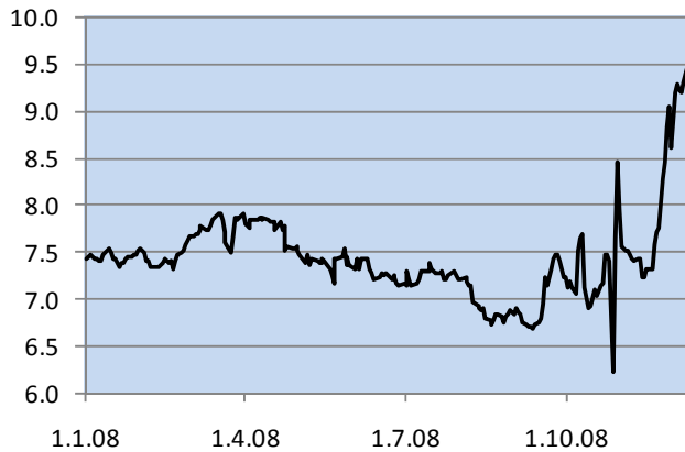
Kuvio 2 Grivna/euro-kurssi vuonna 2008

tasolla, mikä rajoittaa keskuspankin mahdollisuuksia toimia valuuttamarkkinoilla.