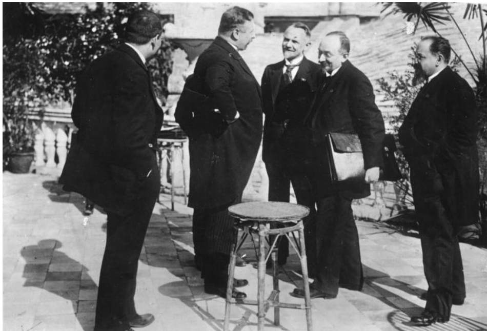
Saksan valtakunnankansleri Joseph Wirth (2. vasemmalta) ja Neuvosto-Venäjän delegaatio (hänestä oikealle): Leonid Krasin, Georgi Tšitšerin ja Adolf Joffe Rapollossa 1922.