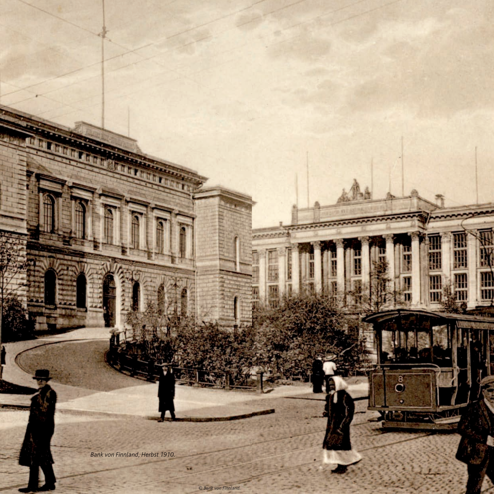
Bank von Finnland, Herbst 1910.