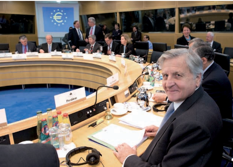
Der EZB-Rat tritt in Frankfurt am Main zusammen.