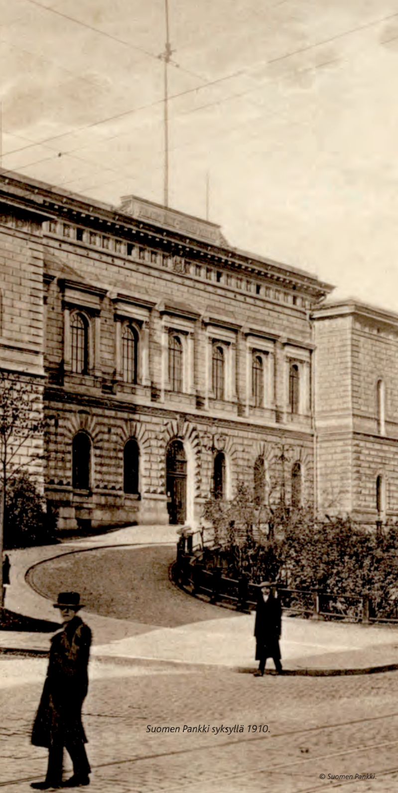
Suomen Pankki syksyllä 1910.