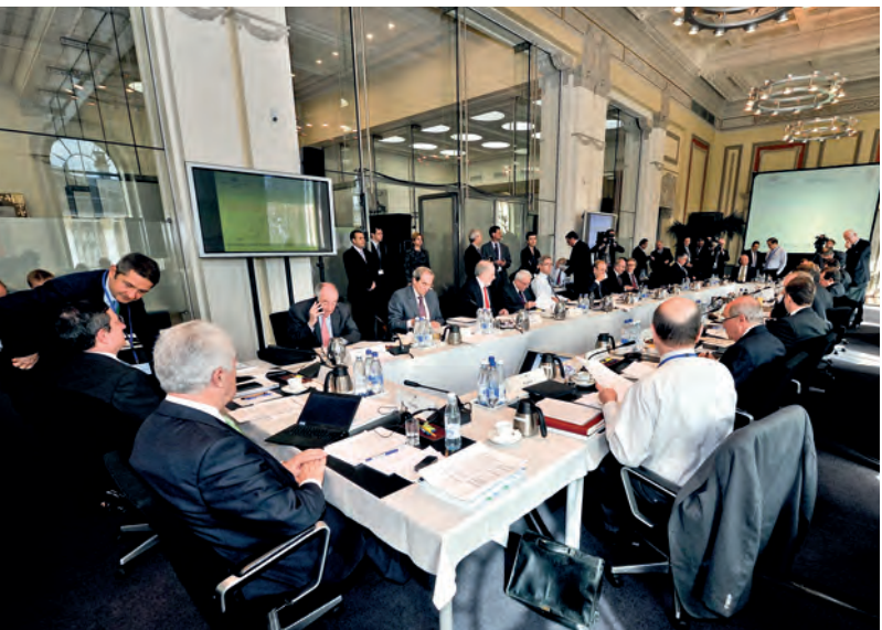
EKP:n neuvoston kokous.