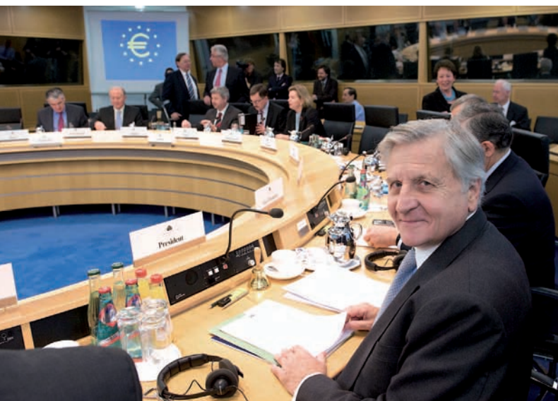
Le Conseil des gouverneurs de la BCE se réunit à Francfort.